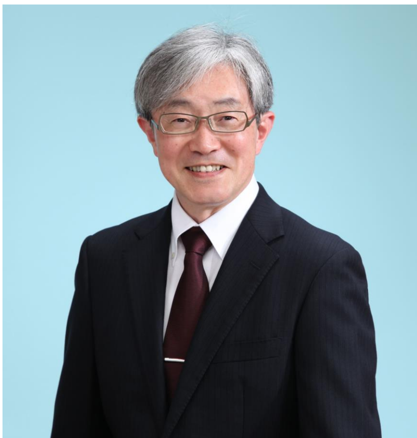
和歌山県和歌山市生まれ

「研修企画工房®」は、合同会社泉恵造研修企画工房の登録商標です。登録第 5496097 号